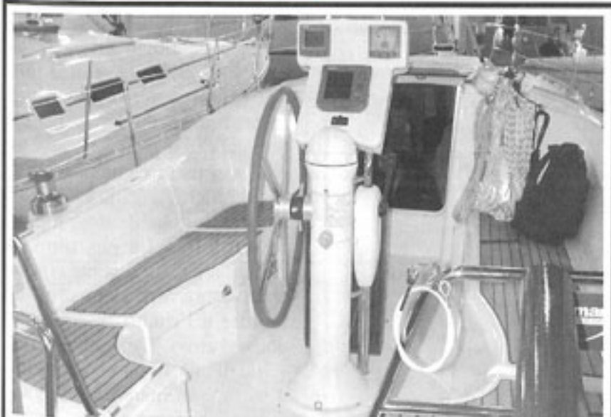
Innovativo il sistema adottato da Bénéteau su alcuni modelli (sopra l' Oceanis Clipper 323 ) per la ruota del timone: orientabile per sgombrare il pozzetto!

Pilot Saloon 40 - Dena wauquiez (gruppo Bénéteau) visitiamo il Pilot Saloon 40 , un'imbarcazione che insieme alla sorella maggiore, Saloon 43 , si differenzia dalla serie Centurion dello stesso cantiere per la tuga elevata e un "saloncino". Da questa zona tecnica