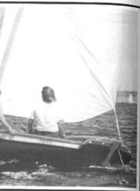
da "passeggio" derivata dai canotti da pesca lunga 4,50 metri viene usata anche in regata.

lette non hanno nulla da invidiare a quelli di un'abitazione cittadina, con il pregio di avere la vista continua del mare da oblò e portelli. Il Privilège 395 dispone di tre cabine doppie (due a poppa nei due scafi, una